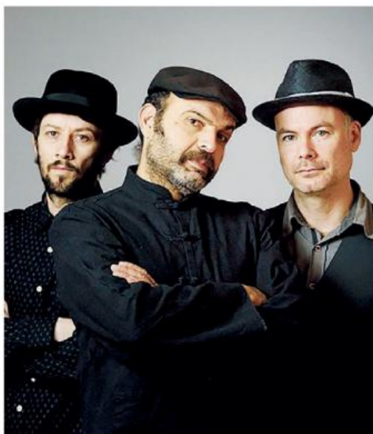
Il concerto. Il gruppo della Fanfara Station

● All'ex Convento del Carmine di Marsala si potrà visitare la mostra «Ignazio Moncada. Attraverso il colore». Da martedì - e sino a domenica - si potrà visitare la mostra dalle 10 alle 11.30 e dalle 17 alle 19. A cura di Sergio Troisi, la mostra è promossa e organizzata dall'Ente Mostra di Pittura Pinacoteca.